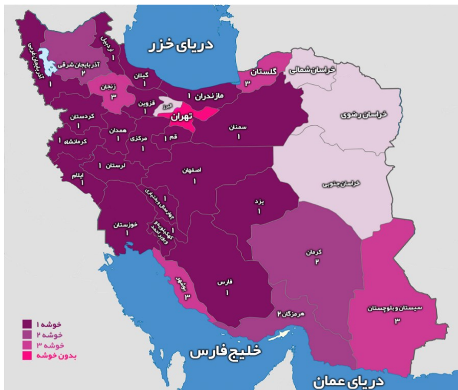
شکل ۴. وضعیت خوشه‌های شناسایی شده در نقشه ایران

مواجه هستیم، زیرا فاصله جغرافیایی قابل ملاحظه‌ای میان سایر استان‌های واقع در خوشه‌های دیگر وجود دارد و این استان‌ها کمترین مجاورت جغرافیایی را دارند. بنابراین نتایج به دست آمده نشان می‌دهد که رهیافت فیلیپس و سول توانسته است ویژگی ناهمگونی شاخص‌های قیمت را آشکار نماید.